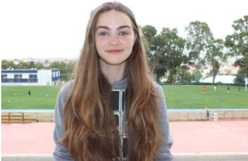
Vive le ballet ! - Jus d'orange – ‘J’ai perdu mon élastique’ – Citation : "It was the best of times, it was the worst of times."