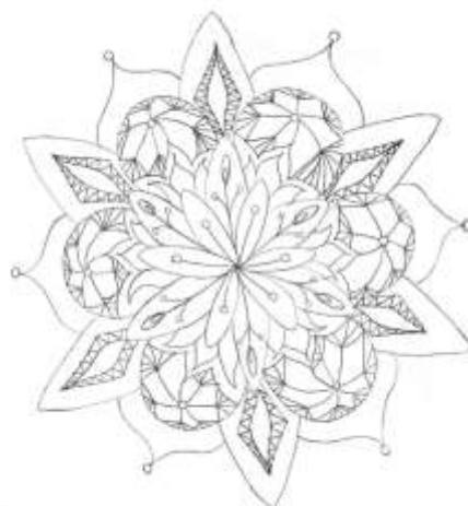
(Salma Benali – Gr 8)